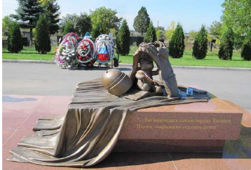
Памятник бойцам спецназа, погибшим при штурме бесланской школы № 1