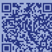
Видеоролики по профилактике экстремизма