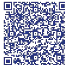
Группа в социальной сети «ВКонтакте»

Работы участников размещены в группе в социальных сетях, с ними можно ознакомиться, перейдя по ссылке