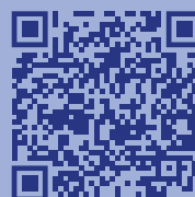
Материалы по профилактике экстремизма